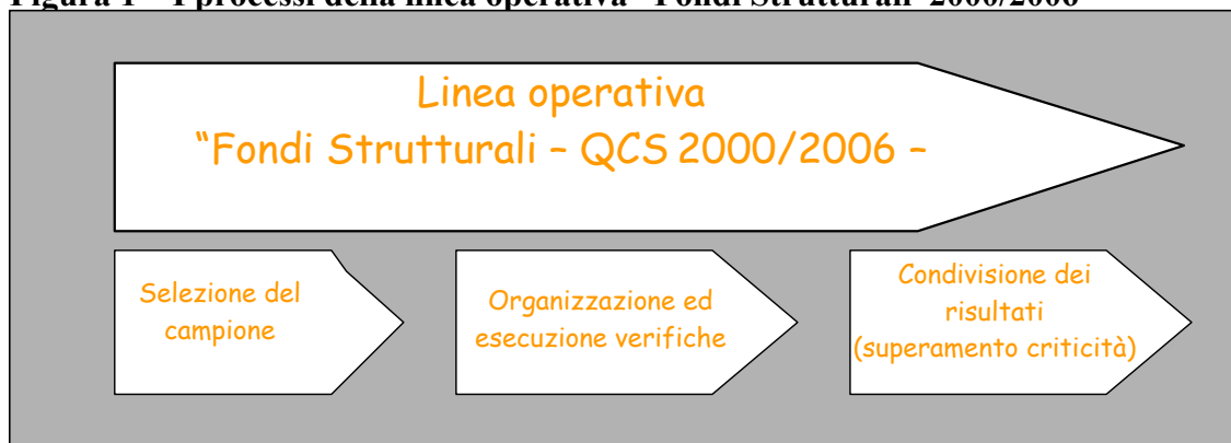
Figura 1 – I processi della linea operativa "Fondi Strutturali 2000/2006 –

Nella Figura 1, di seguito riportata, sono riprodotti i processi in cui si articola la linea operativa "Fondi Strutturali – QCS 2000/2006 –".